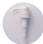
ポンプ シャンプー用 価格：180円(1本)

髪を十分に濡らした後、適量を手に取り、よく泡立ててから髪に行き渡らせます。頭皮になじませながら、髪全体を洗います。その後、シャンプーが残らないようにしっかりとすすぎます。