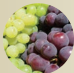
ブドウ種子エキス