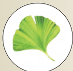
イチョウ葉エキス