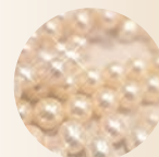
パールプロテイン