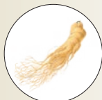
オタネニンジンエキス