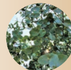
ユーカリ葉エキス