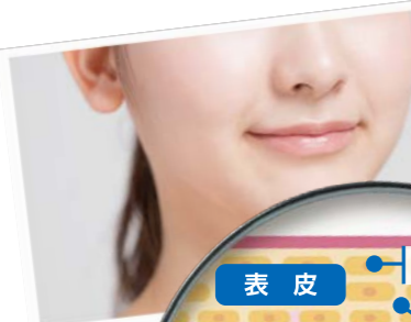
肌の構造 (イメージ)