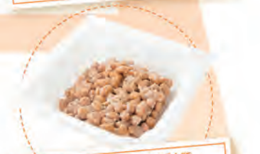
納豆1パック たんぱく質 約8g