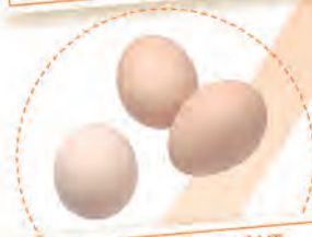
生卵 1個 たんぱく質 約7g