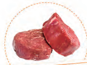
肉(鶏、豚、牛) 各100g たんぱく質 約17~20g

普通の人が1日に必要なたんぱく質の量の目安は「 体重1kgに対して1g 」。つまり 体重50kgの人であれば、50gが適量 とされています。また、体のたんぱく質は常に古いものが新しいものに入れ替わっているので、毎日、不足しないように摂取する必要があります。