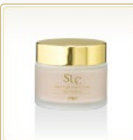
スキンライトナー クリーム