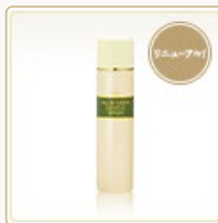
ジェントルウォッシュ