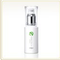
エリナ ノビレチュラ エッセンス